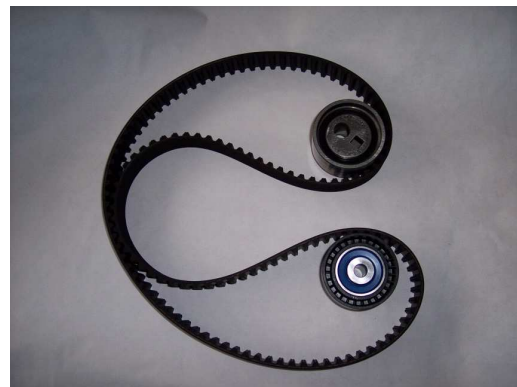
Új SKF VKMA 03244 / 03247 tartalma